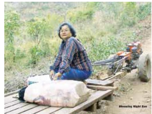
Blooming Night Zan

Para leer un informe detallado sobre más de 4000 casos de abuso, vaya a www.karenwomen.org y haga clic en Caminando entre Cuchillo Afilados. Blooming Night ayudó a reunir información para este reporte.